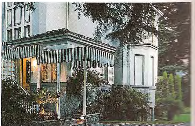
Villa Mozart in Meran

Dort erhält man, ebenso wie beim Landesverkehrsamt, eine abgebildete Broschüre mit der genauen Beschreibung von über 400 Höfen. Eine ähnliche Broschüre gibt es beim ADAC. Ein Zimmer mit Frühstück kostet etwa 9500–13000 Lit.