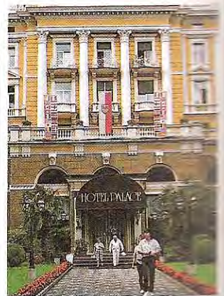
Hotel Palace in Meran

Mustergasse 9 39100 Bozen Ferienwohnungen in Schloß Warth und Anstiz Kreidhof) und Meran (Schloß Rubein). Ferienwohnungen kosten etwa 16000–60000 Lit pro Tag. Wer auf einem Bauernhof unterkommen möchte, wende sich an den Südtiroler Bauernbund, Abteilung „Urlaub auf dem Bauernhof“ Brennerstraße 7 39100 Bozen Tel. 0471/972145